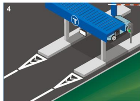
Sona un bip a l'aparell, el semàfor es posa verd i s'obre la barrera