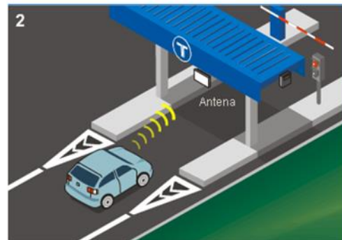
El sistema identifica el titular de l'aparell