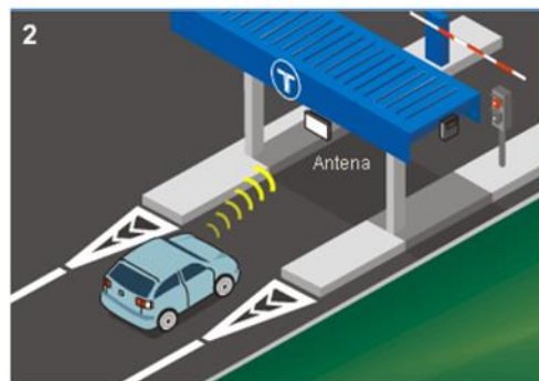
El sistema identifica al titular del aparato.