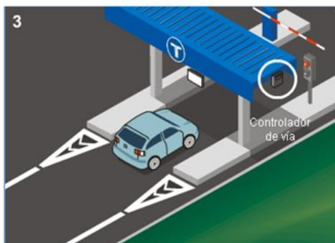
Se realiza la lectura del dispositivo.