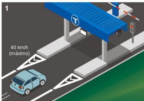
El coche se acerca a 40 km/h (máx.).

Para que el dispositivo VIA-T funcione correctamente, el vehículo debe acercarse al peaje por el carril preparado para realizar la lectura del aparato (indicado con una T) a una velocidad máxima de 40 km/h. Una vez realizada la lectura, suena un “bip” en el aparato y la barrera se abre.